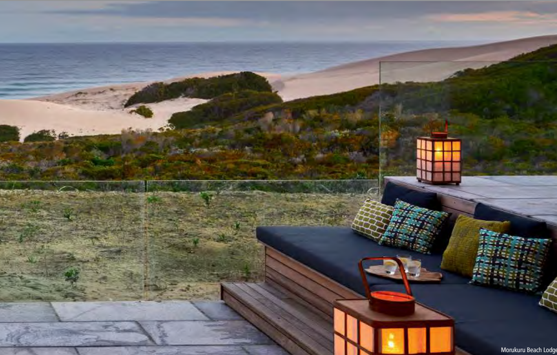
Morokuru Beach Lodge