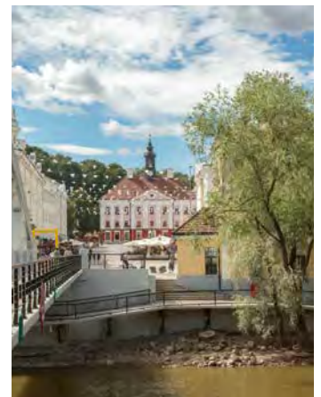
Tartu: «Ville des intellectuels» d'Estonie, petite mais raffinée.

Voyageur seul en chambre individuelle sur demande.