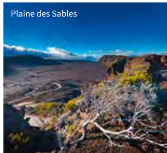
Plaine des Sables