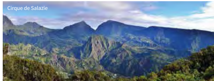
Cirque de Salazie