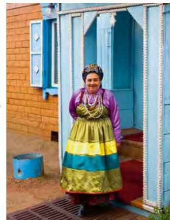
La rencontre avec les locaux promet de beaux moments.

rusgolmw_f (Moscou-Vladivostok) rusgolwm_f (Vladivostok-Moscou)