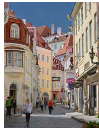
Flânez dans les ruelles historiques de Tallinn.

*Dates spéciales à St-Pétersbourg: 03-07.06/12-21.06 et 19-26.07 Tous les prix sont sur demande.