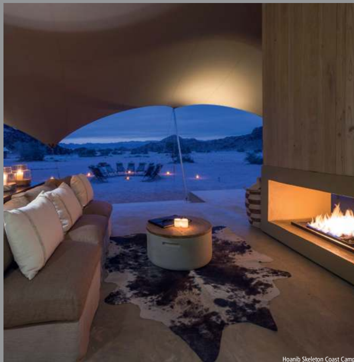
Hoanib Skeleton Coast Camp

Aujourd'hui, vous vous envolez pour le sud du Parc National Etosha, plus précisément la réserve privée d'Ongava, qui se trouve près de la porte d'Andersson. Cet après-midi, vous pouvez prendre part à un safari sur la concession du lodge. La réserve d'Ongava est connue pour sa population de lions et de rhinocéros. Little Ongava fait partie des plus luxueux logements de Namibie. L'architecture est inspirée