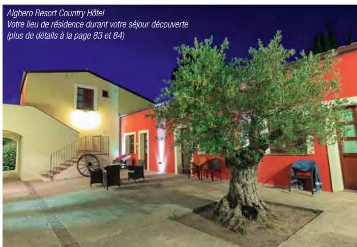
Alghero Resort Country Hôtel Votre lieu de résidence durant votre séjour découverte (plus de détails à la page 83 et 84)