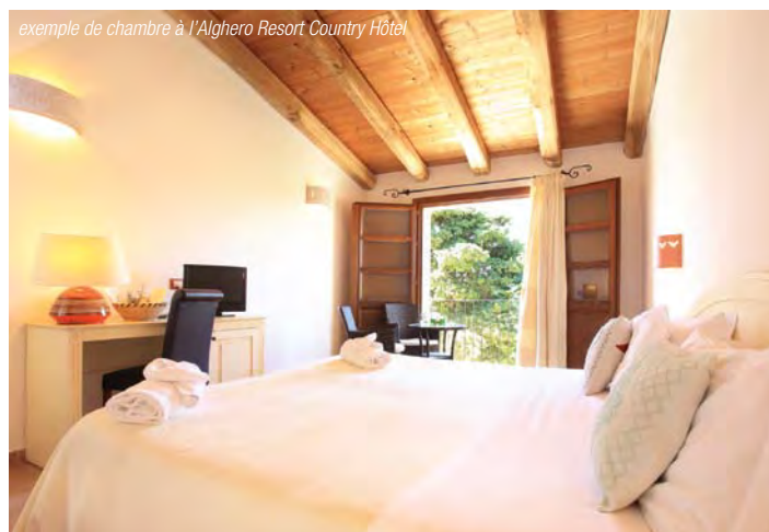
exemple de chambre à l'Alghero Resort Country Hôtel