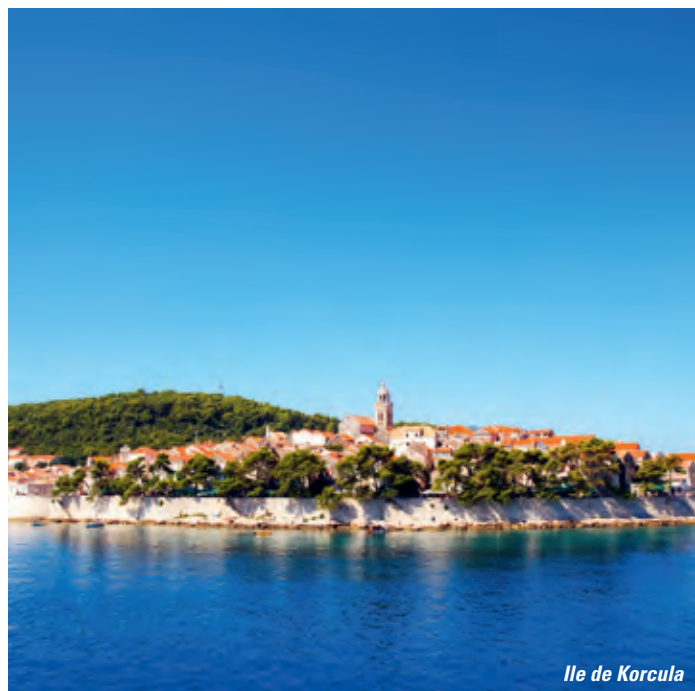
Ile de Korcula

Restitution de votre voiture de location à l'aéroport de Split et envol pour la Suisse.