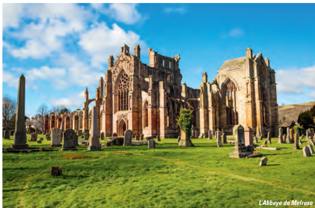
L'Abbaye de Melrose

Remarque: (*) alternance de Bed & Breakfast et d'hôtels 3 étoiles, y compris 2 nuits en manoir ou en château.